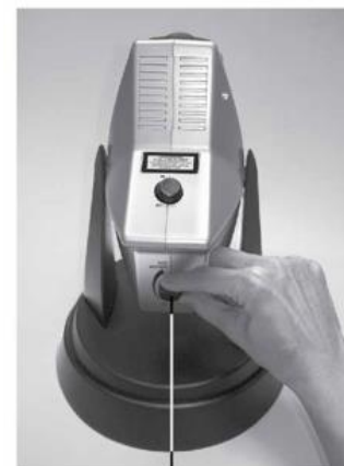
Cloud Brightness Control