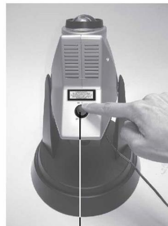
On/Off Button Aan/uit knop